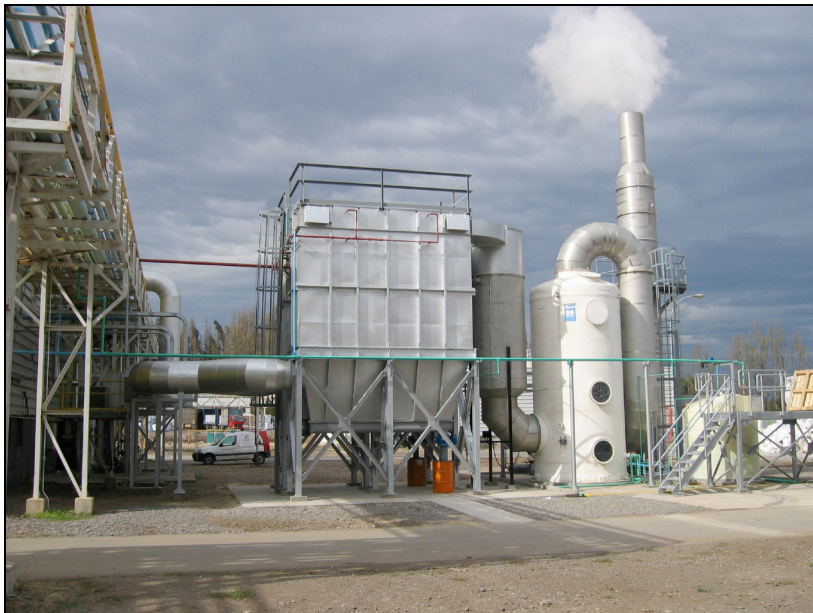
Figura N°2: Filtro de Mangas para MP y Scrubber para SO2.

La dosificación del químico, que reaccionará con el \text{SO}_2 , se controla mediante el pH de la solución (agua recirculada en contraflujo con los productos de la combustión).