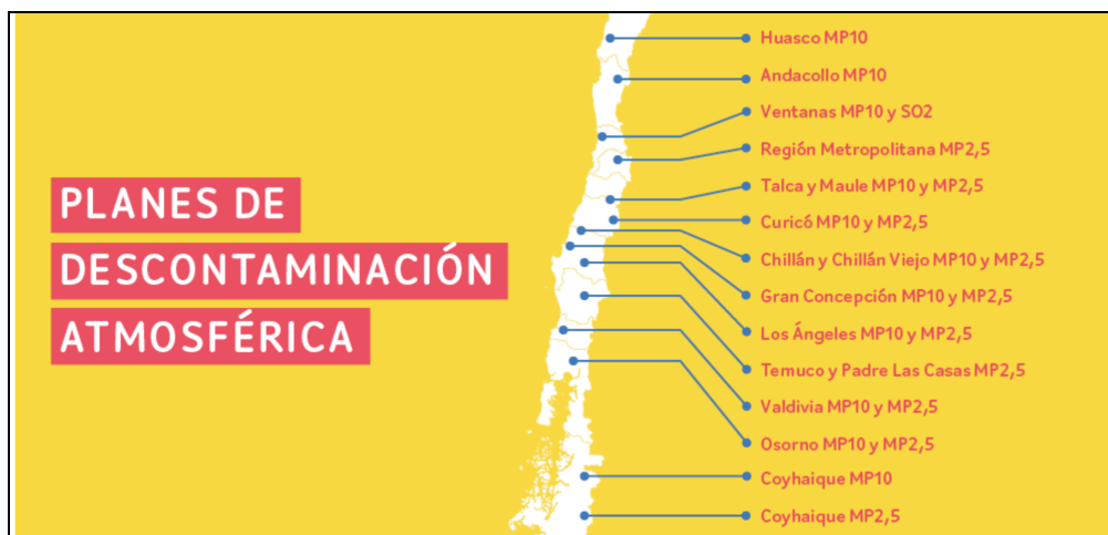
Figura N°1: PPDA por Región de Chile.

En la figura N°1 se muestran la regiones en las cuales existentes PPDA vigentes o en proceso de implementación.