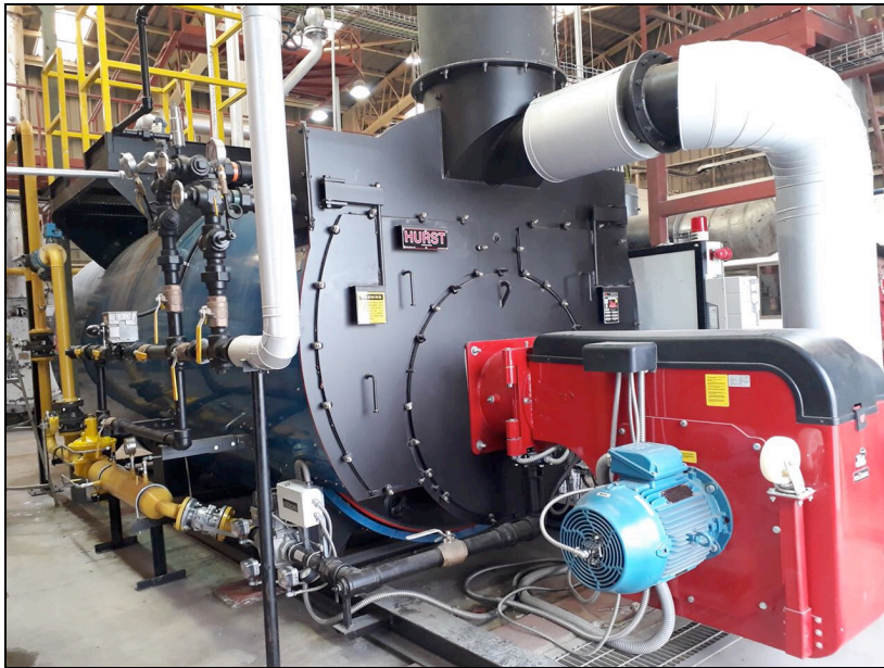
Figura N°3: Caldera con quemador de bajo NOx (recirculación de gases)

Las reducciones en las emisiones de NOx conseguidas con este sistema son de aproximadamente un 70 % a 80 % y son aplicables principalmente para quemadores que usan combustibles gaseosos.